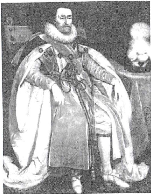
Iacob I (Daniel Mytens)

Iacob I (1603-1625) a fost primul suveran britanic de origine scoțiană. Fiu al nefericitului lord Darnley (←) și al Mariei Stuart (←), el devine, la vârsta de un an (1567), rege al